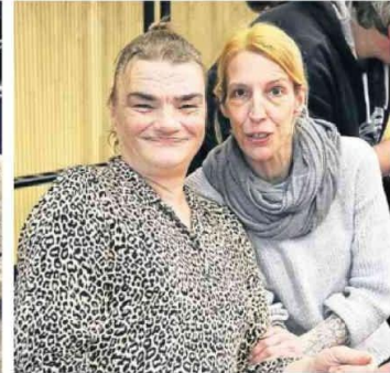
Freude übers Wiedersehen auf der Weihnachtsfeier.

Weihnachtsfeier des Netzwerks „Wohin? zu Hause in Rheine“ im Begegnungszentrum „Mitte 51“