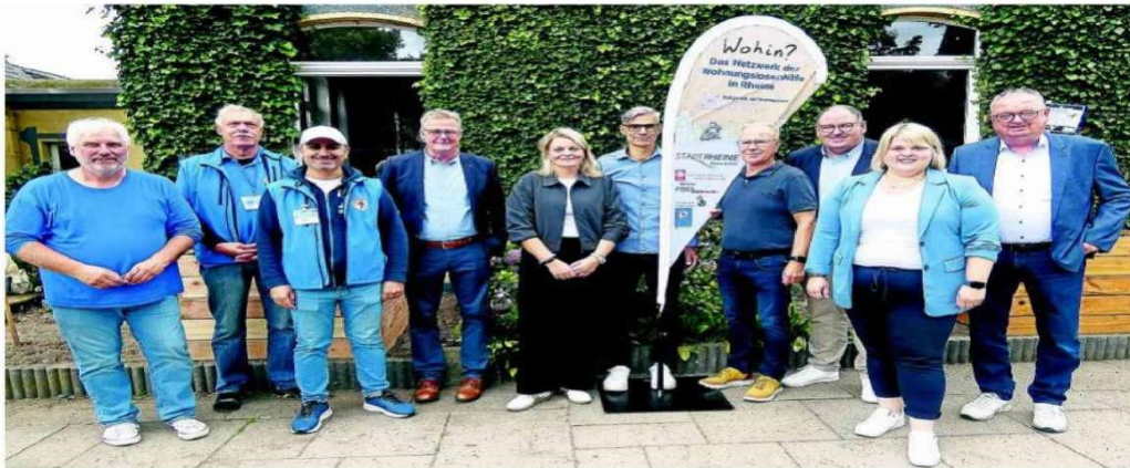
Die Partnerinnen und Partner des Netzwerks „Wohin? Zu Hause in Rheine“ trafen sich zu einem Sommerfest im Innenhof der Begegnungsstätte Centro S. Antonio.

RHEINE. Wenn Gemeinschaft mehr bewirkt als Worte, zeigt das fünfte Sommerfest des Netzwerks „Wohin? Zu Hause in Rheine“ eindrucksvoll, wie Zusammenhalt Leben verändern kann. Diese Veranstaltung bringt Menschen zusammen und schenkt ihnen Unterstützung und Hoffnung.