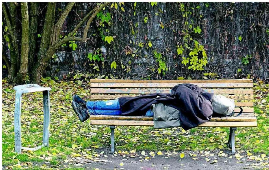
Zehn bis 15 Menschen in Rheine wohnen laut Schätzungen dauerhaft auf der Straße, sind obdachlos. Die Stadt weist auf Hilfen hin.

In Rheine gibt es das „Netzwerk Wohin? – Zuhause in Rheine“, in dem sich seit 2019 mehrere Organisatio-