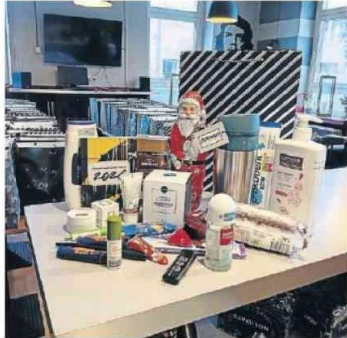
Dieses Geschenk erhielten die Gäste.