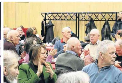
... und den Gästen hat es gefallen.