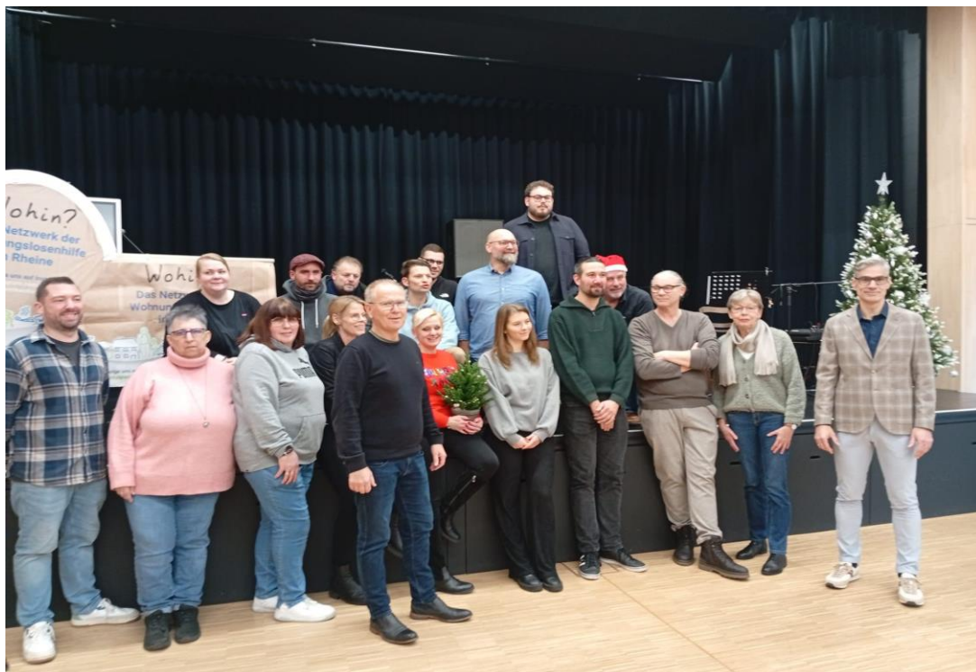
Die Mitarbeitenden des Netzwerks „Wohin? zu Hause in Rheine“

Das Hilfenetzwerk „Wohin? zu Hause in Rheine“ hat sich im Jahre 2019 gegründet. Das Netzwerk ist ein Zusammenschluss von sozialen Einrichtungen der Stadt Rheine, der Drogenberatung Rheine der Bahnhofsmision, der Suppenküche der Caritas Rheine und der Wohnungsnotfallhilfe der Caritas Rheine. Die Zusammenarbeit im Netzwerk wurde weiterhin intensiviert und wird zusätzlich in einem Instagram Kanal @netzwerkwohin und dem Youtube-Kanal der Stadt Rheine mit Inhalten präsentiert.