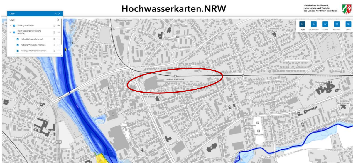
Hochwassergefahrenkarte NRW HQextrem (Quell: http://www.hochwasserkarten.nrw.de/ ; aufgerufen am 31.03.2026)

zur Ems entfernt und wird nicht beeinflusst. Vor diesem Hintergrund sind zur Gefahrenabwehr keine weiteren Maßnahmen auf städtebaulicher Ebene erforderlich.