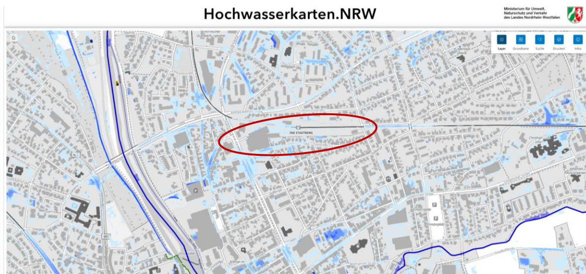
Starkregenisikokarte NRW HQextrem (Quell: http://www.hochwasserkarten.nrw.de/ ; aufgerufen am 31.03.2026)

Hinsichtlich des Starkregenisikos kann auf der Plangebietsfläche eine Beeinträchtigung festgestellt werden. Hierbei handelt es sich um Bereiche, die bei Starkregenereignissen überschwemmt werden können und kurzzeitig unter Wasser stehen können. Auf bauleitplanerischer Ebene wird dieser Punkt aufgegriffen, indem ein Rückhaltekonzept vorgesehen wird, das eine gedrosselte Ableitung des anfallenden Niederschlagswassers in das ausreichend dimensionierte öffentliche Kanalnetz gewährleistet. Weitere Detailklärungen und Konkretisierungen werden auf Ebene der verbindlichen Bauleitplanung vorgenommen.