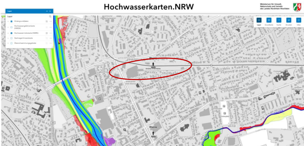
Hochwasserrisikokarte NRW HQextrem (Quell: http://www.hochwasserkarten.nrw.de/ ; aufgerufen am 31.03.2026)

Mit dem Blick auf die Hochwasserrisikokarte NRW kann festgestellt werden, dass angrenzende Uferbereiche der Ems und des Hemelter Baches einem Hochwasserrisiko unterliegen. Für das Waldgebiet selbst lässt sich kein Hochwasserrisiko bei HQextrem-Ereignissen feststellen, weshalb auf städtebaulicher bzw. planerischer Ebene kein Handlungserfordernis besteht.